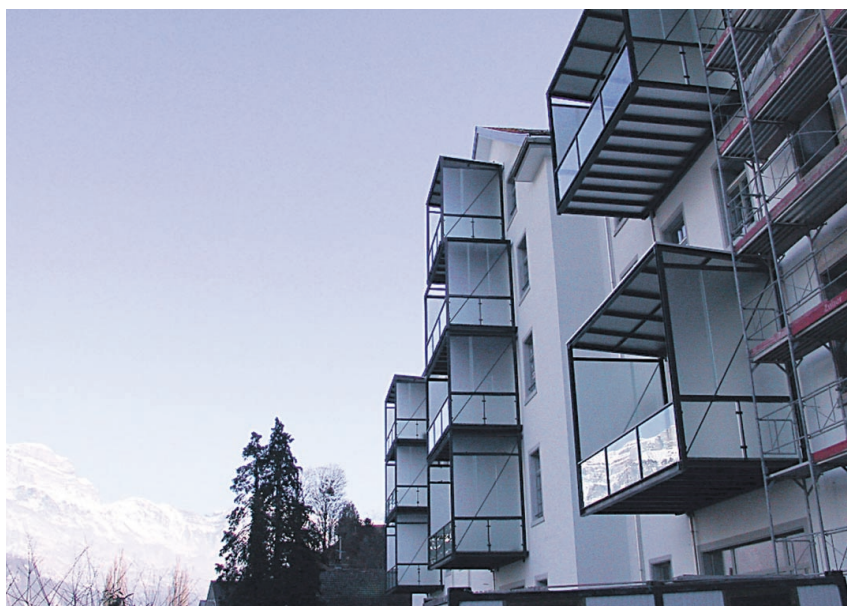
Alt und neu: Während die Ergebnisse der ersten Bauetappe auch von aussen sichtbar sind, sind auch deutliche Spuren der aktuellen, sich im Gang befindenden Bauetappe sichtbar (rechts).

Von wenigen Details abgesehen, ist auch das Lofthotel fertiggestellt. Es befindet sich im östlichen Teil der alten Spinnerei und verfügt insgesamt über 12 Zimmer, die einzeln, doppelt und teilweise auch bis zu viert belegt werden können. Seit September beherbergt das spezielle Hotel Gäste. In der Anfangsphase müssen diese allerdings noch auf die Leselounge, den Seminar- und den Fitnessraum verzichten. Diese Räumlichkeiten stehen kurz vor der Realisierung und sollen