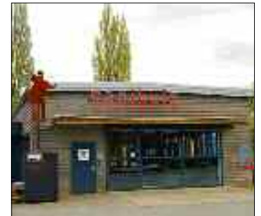
«Sagibeiz»: Speiserestaurant, Konzert- und Eventlokal in einem.