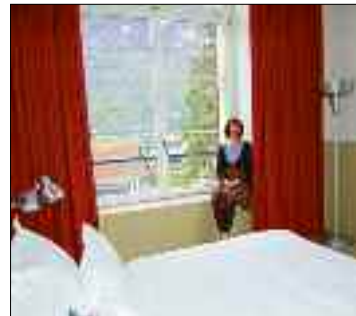
Zimmer mit Aussicht auf den Walensee und die Churfürsten.