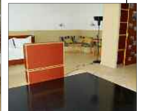
Zweiradfans können ihr Gefährt mitten im ebenerdigen «Biker-Zimmer» parken (schwarze Fläche).