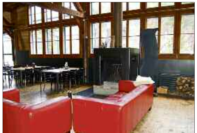
Blick in die «Sagibeiz». Seit 2002 ist das ehemalige Lagerhaus der alten Spinnerei ein Treffpunkt für Gäste aller Altersgruppen und Liebhaber einer unkomplizierten, aber stilvollen Küche.