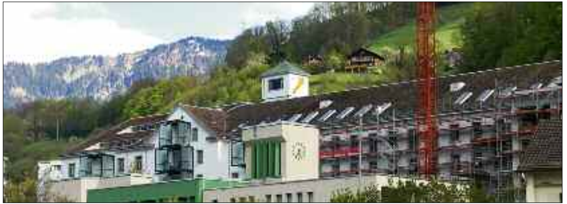
Das Lofthotel befindet sich im linken Teil der alten Spinnerei. Im Türmchen (mit dem gelben Fadenspulen-Logo) entsteht eine über mehrere Etagen reichende Suite. Der grösste Teil des 10 000 m 2 umfassenden Gebäudes befindet sich noch im Umbau. Hier entstehen Lofts, die als Wohnung, Büro oder Produktionsstätte dienen.

*Murg ist der einzige Ort in der Deutschschweiz mit einem eigenen Kastanienwald.