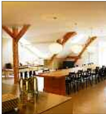
Unterm Dach des Lofthotels finden exklusive kleine Dinners statt.