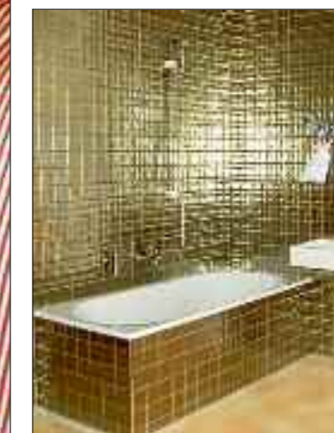
Metallener Glanz: Das Lofthotel ist in einem ehemaligen Industriebäude. Das zeigt sich sogar im Bad.

Einem Gästewunsch folgend, hat das Lofthotel im Erdgeschoss zwei spezielle «Biker-Zimmer» eingerichtet. Motorradfans und Velocraics können ihre Zweiräder mit ins Zimmer nehmen. Das dekorativ in der Zimmermitte geparkte